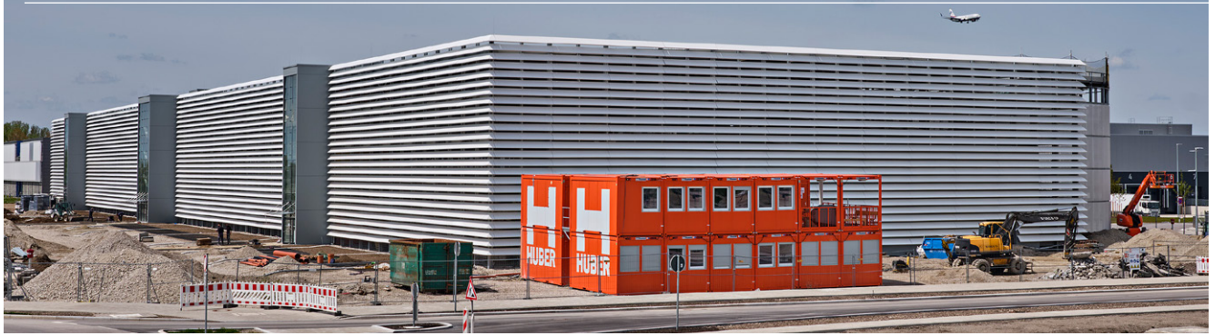
Das neue Parkhaus P44 am Flughafen München mit rund 2.000 Stellplätzen